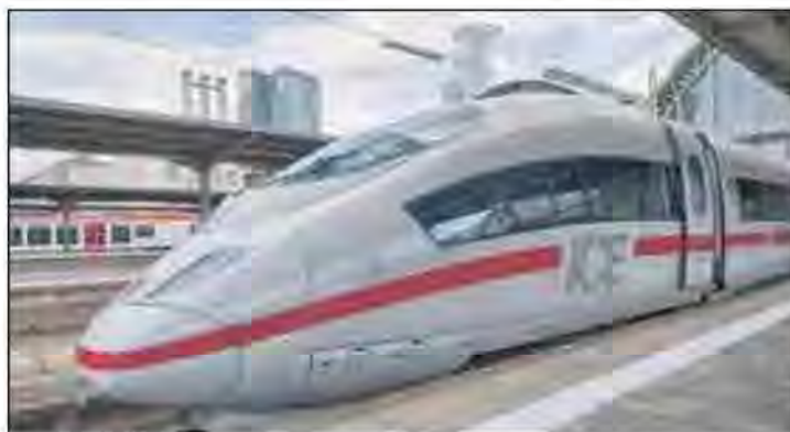
Si chiama Ice il treno ad alta velocità tedesco. Uno su quattro non è puntuale

Capita», ha scritto filosoficamente un altro passeggero deluso, e a un tratto l'annuncio: ci dispiace, questo Ice termina la sua corsa a Kassel». Spiegazioni? Nessuna. In autunno si ritarda perché le foglie cadono sui binari e intasano gli scambi, in inverno ovviamente cade la neve, e gli scambi gelano, in estate si surriscaldano. Tutti inconvenienti comprensibili, riconoscono gli utenti, ma perché in un non lontano passato si prevedeva che a luglio fa caldo, a dicembre nevica, e a ottobre cadono le foglie, e si correva ai ripari? Si parte ancora da Amburgo, ma ci si ferma dopo pochi chilometri nel sobborgo di Harburg, venti minuti di attesa e arriva infine la spiegazione: «Ci dispiace, vi prego cento volte di scusarci, ma qualcuno ha dimenticato di riservare una linea per questo treno... vi prego, per favore, di risparmiare i commenti». Dalle lettere si nota che i passeggeri preferiscono reagire con ironia. E sfatano un altro pregiudizio: che i tedeschi non abbiano senso dell'umorismo.