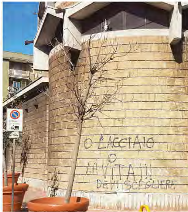
Nel quartiere Tamburi. Così, qualcuno, sulle mura della chiesa di San Francesco De Geronimo, ha sintetizzato il valore della vita a Taranto

Il reportage e la gallery completa delle foto