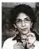
Il profilo Fabiola Gianotti, 57 anni, direttrice generale del Cern, l'ente europeo per la ricerca nucleare

La conoscenza non ha passaporto, non ha genere, non ha razza e non ha partito politico