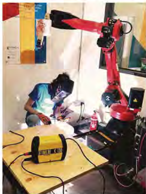
Community. Tecnologie digitali e macchine analogiche al FabLab di Milano