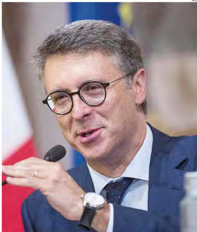
Anticorruzione. Il presidente dell'Anac, Raffaele Cantone