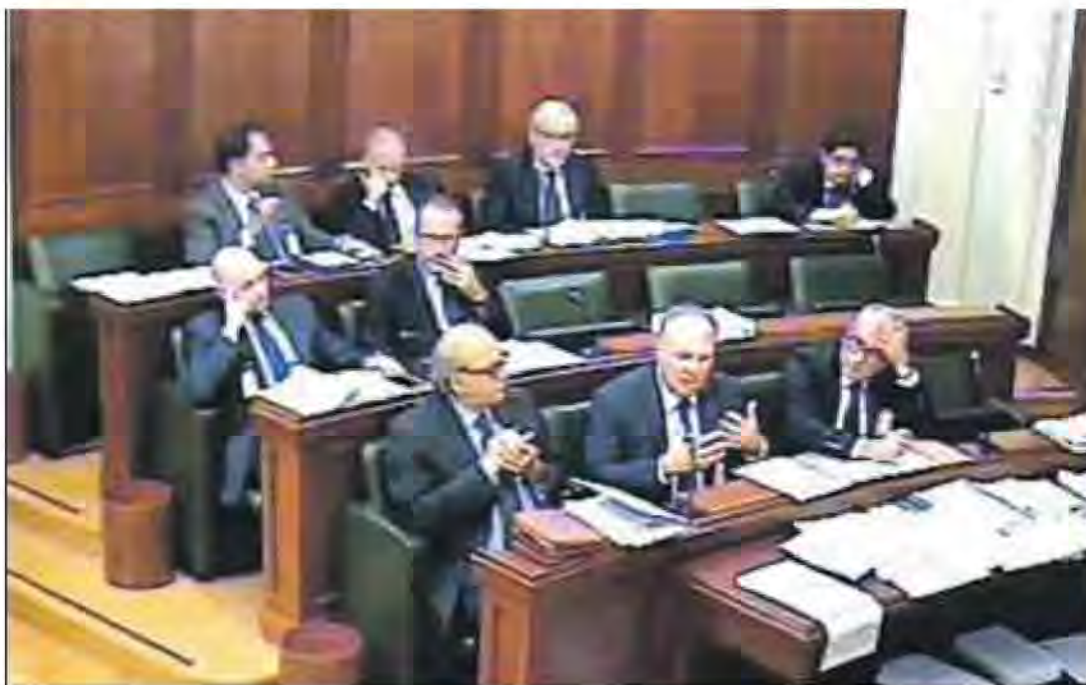
Audizione della Rpt e dell'Adepp sul ddl 2858, presso la Commissione Lavoro del Senato

* Presidente del Consiglio nazionale geometri e geometri laureati