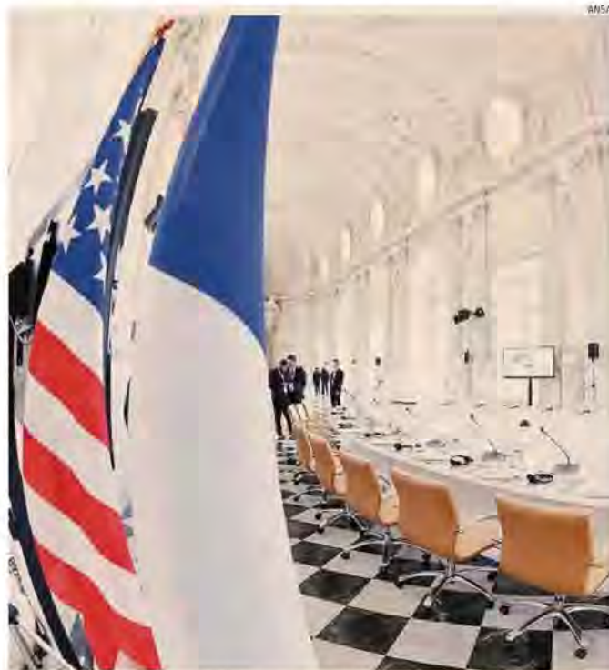
G7 dell'Industria. I desk di lavoro alla Reggia di Venaria Reale