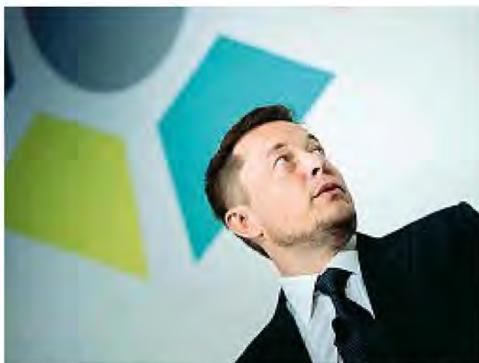
Visionario Il miliardario sudafricano con cittadinanza Usa Elon Musk

● Inventore Elon Reeve Musk, nato in Sudafrica 46 anni fa, è un imprenditore e inventore (qui il suo schizzo dell'Hyperloop) considerato tra gli uomini più influenti al mondo (21esimo nella classifica Forbes 2016). Dal 2002 è cittadino Usa. Ha creato la Space Exploration Technologies Corporation (SpaceX) e la Tesla Motors